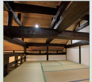
山あじさいイメージ

このプランは、最少催行人員が2名様からとなっており、最大で6名様までのご参加が可能です。無料送迎、現地でのイベント付。季節により各種体験の内容が異なりますが、多くの体験をしていただく予定です。