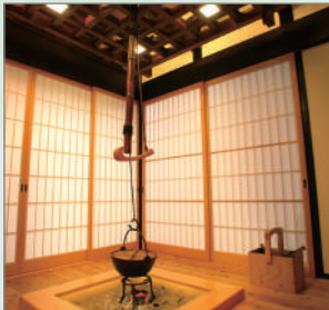
山あじさいイメージ

民宿・山あじさいの1泊2食付き宿泊+イベントプランです。今回のプロジェクトスタート記念でのモニタープランです。特別な特典が満載です。