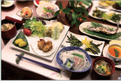
山あじさい夕食イメージ

お母さんの手作り料理は自慢の地元の食材をふんだんに利用した食事です。とにかく驚きで、TV番組にも取り上げられる鬼北町自慢の宿です。1泊2食付きの通常の宿泊プランです。1日1組の限定の基本プランです。